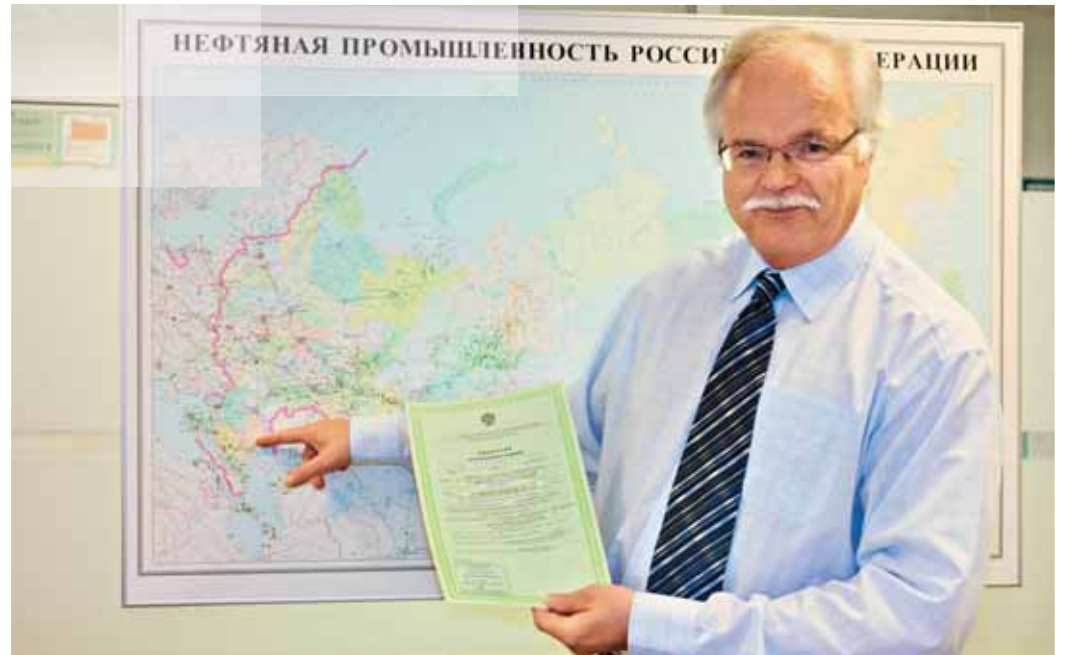
Вице-президент «Шелл» по геологоразведке в России, Каспийском регионе и на Украине Кристиан Букович

Население Калмыкии составляет 284 тысячи человек. Калмыки являются единственной нацией в Европе, исповедующей тибетский буддизм (ламаизм) в качестве основной религии.