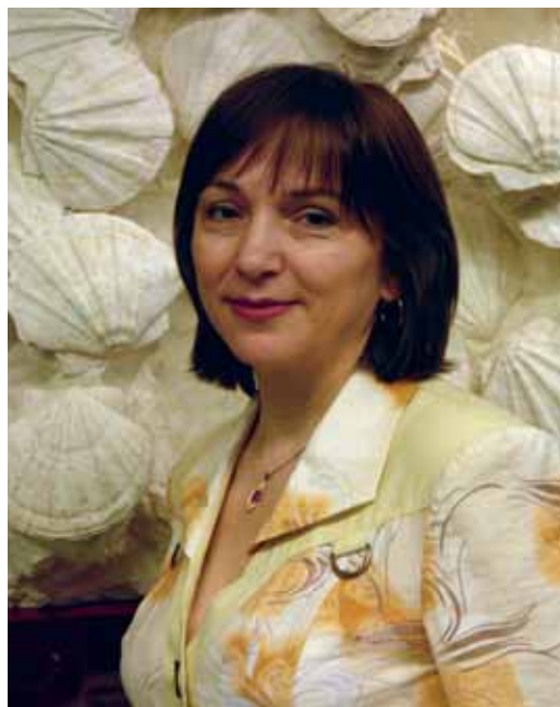
Охрана труда является важнейшей задачей концерна «Шелл» вне зависимости от вида

выполняемых работ. «Шелл» стремится свести к нулю возможность причинения ущерба сотрудникам, подрядчикам, а также третьим лицам и окружающей среде. Эта задача легла в основу программы «Цель – Ноль». Сотрудники и подрядчики концерна прилагают максимум усилий, чтобы сделать работу на предприятии более безопасной.